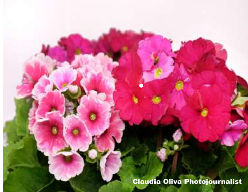
Claudia Oliva Photojournalist